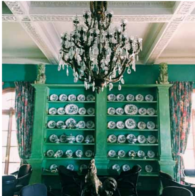
HÔTEL VILLA JOSÉPHINE