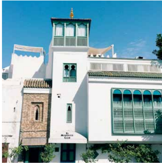
EL MOROCCO CLUB

€€€ / 231, rue Sidi-Mesmoudi www.villajosephine-tanger.com