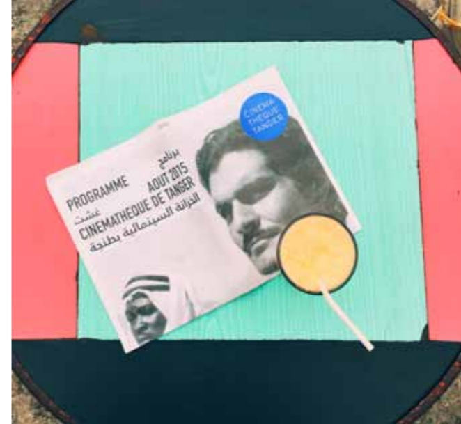
CINÉMATHÈQUE DE TANGER