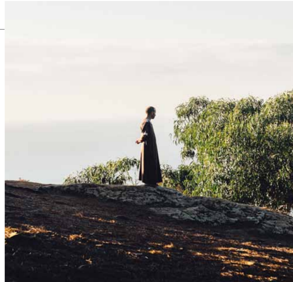
PROMENADE DES ROMAINS, VIEILLE MONTAGNE