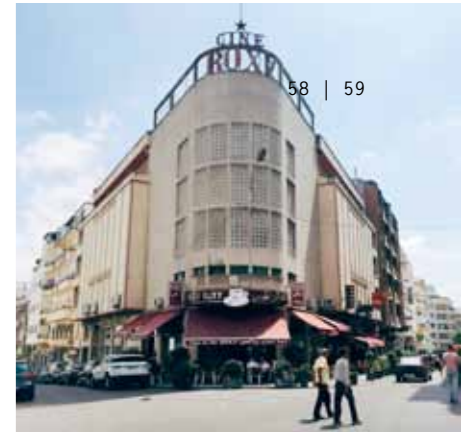
LE CINÉMA ROXY