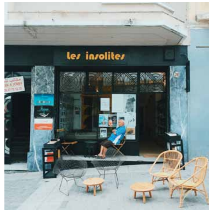
LIBRAIRIE-GALERIE LES INSOLITES

28, rue Khalid-Ibn-Oualid (ex-rue Velázquez) www.lesinsolitestanger.com