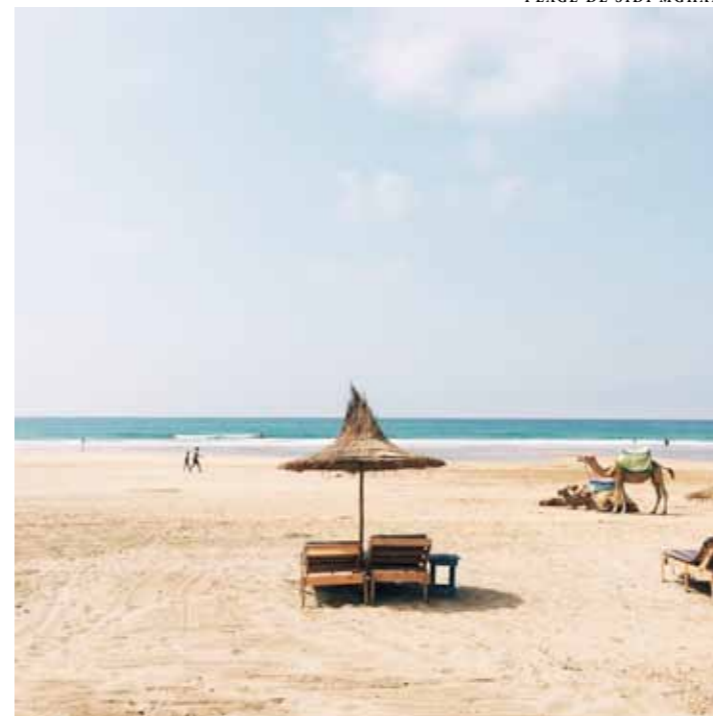
PLAGE DE SIDI MGHAIT

Rencontrer Tangier c'est un peu comme tomber amoureux. Les premiers émois se jouent à peu de choses, avoir le coup de foudre ou pas. Une beauté parfois déconcertante, farouchement poétique, elle n'est pas du genre à se donner tout de suite. Il faut l'effleurer, l'apprivoiser, mais une fois que vous l'aurez goûtée, vous ne l'oublierez jamais. Le Maroc, en tête à tête avec l'Espagne, d'un côté la Méditerranée, de l'autre l'Atlantique, Tangier est une ville belvédère où l'on grimpe sur les toits, sur la kasbah, sur la Vieille Montagne. Une ville en cascade vers la mer, qui ondule entre ici et ailleurs, hier et demain. Envoûteuse, la cité blanche du détroit en a troublé plus d'un : une lumière pour les peintres, une muse pour les écrivains, un eldorado. Puis, nostalgique, indomptée, vivant le rêve éveillé de ses légendes, la princesse du Nord a somnolé pendant un temps, délaissée par la royauté. Pour finalement retrouver une place dans son cœur, devenir un point d'ancrage, un port d'envergure, une oasis de villégiature. Cinémathèque, librairies, festivals de musique, Tangier a pris la tangente, la culture lui redonnant fière allure. Alors suivez nos pas : repaires de toujours, nouveaux écrins, bonne pêche, doux délices et paradis perdus. Tangier est un bijou, il suffit de l'essayer.