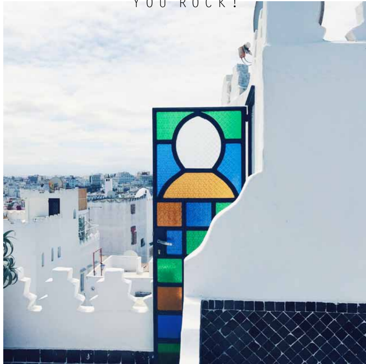
VUE DEPUIS LE NORD-PINUS TANGER