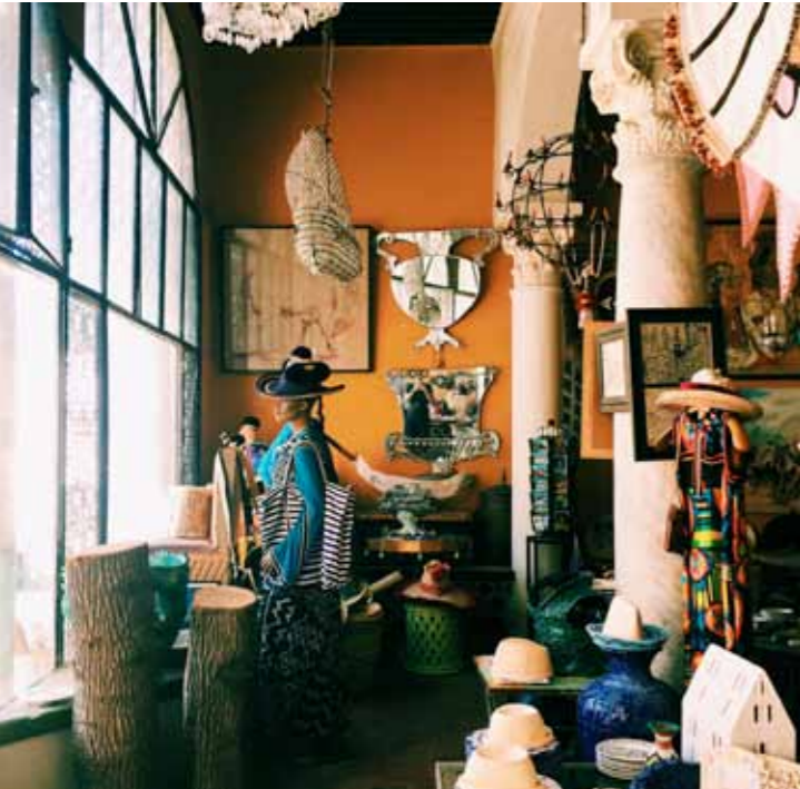
GALERIE LAURE WELFLING