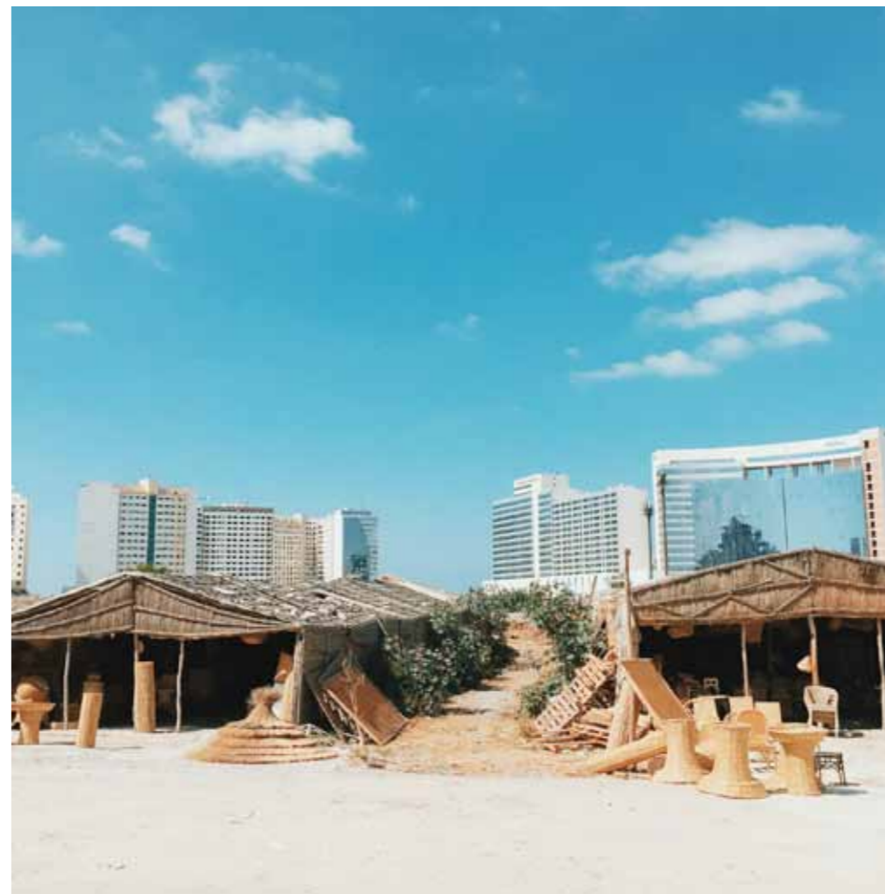
LE MARCHÉ D'OSIER