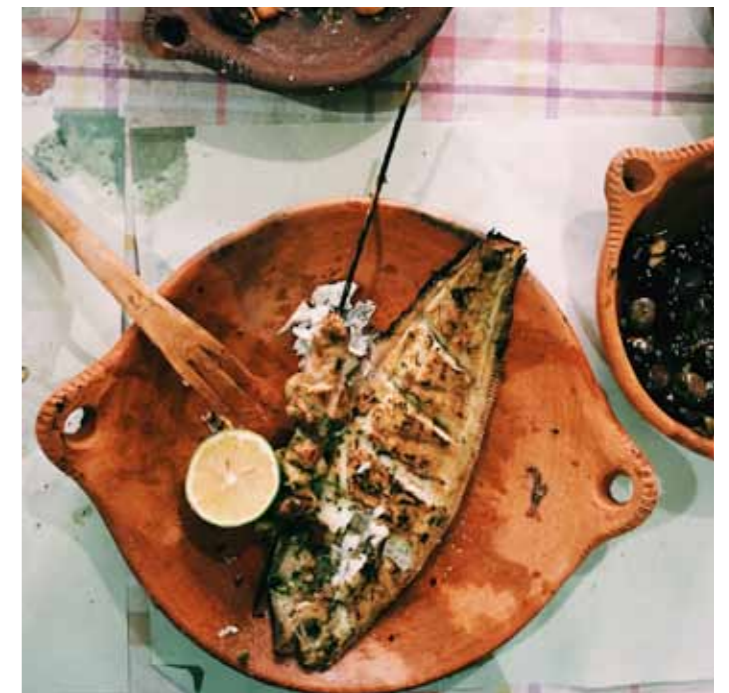
SAVEUR DE POISSON