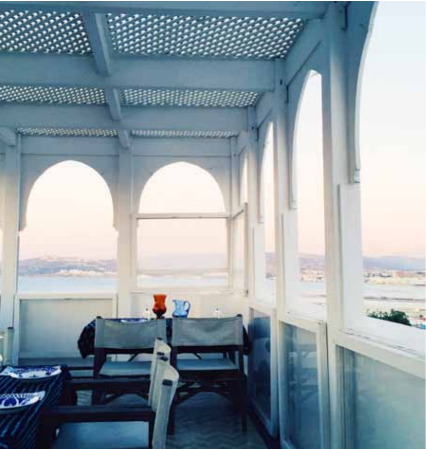
RESTAURANT NORD-PINUS TANGER