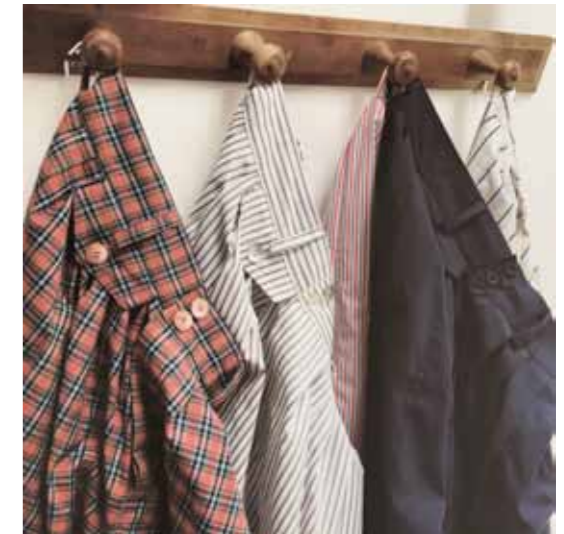
NOUSS NOUSS / PHOTO @NOUSSNOUSS TANGER

Pour l'adresse précise, oubliez donc, et faites comme on vous dit : sautez dans un taxi et demandez-lui de vous conduire au marché d'osier vers la gare routière et le quartier du Charf (à ne pas confondre avec l'Hôtel Charf). En débarquant, on ne sait pas trop où l'on est, mais si vous êtes un toqué d'osier c'est juste le pied ! Petits paniers, abat-jours, mobilier, ça tresse à tout va et on peut même leur demander du sur mesure. Évidemment, tout ça à prix détonants.