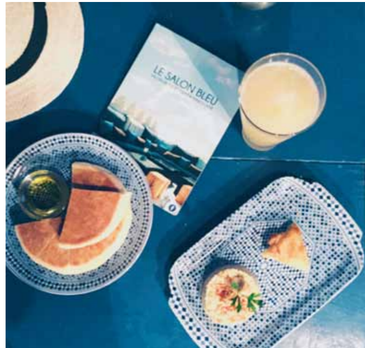
LE SALON BLEU

€ / Place de la Kasbah, entrée par le 71, rue Amrah / www.darnour.com / @darnour