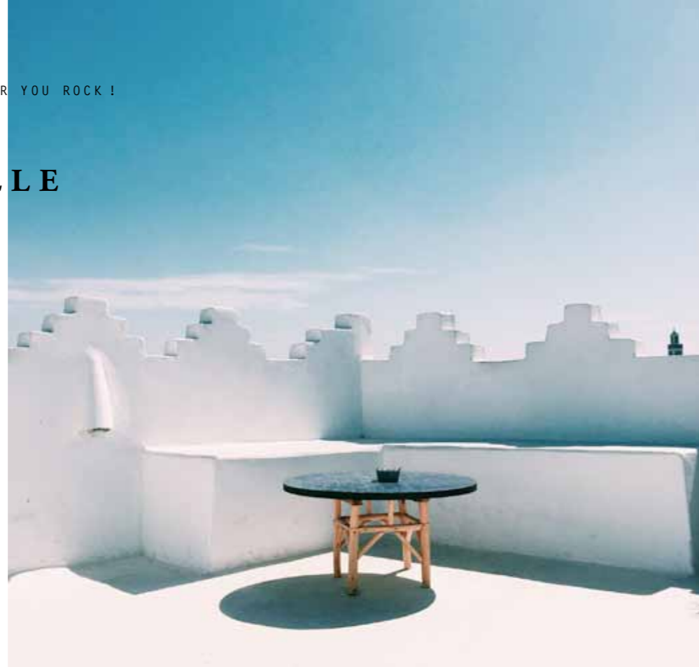
UNE DES TERRASSES DU DAR NOUR

€€ / 20, rue Gournas, Kasbah www.darnour.com / @darnour