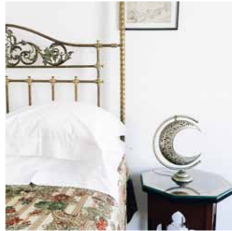
HÔTEL NORD-PINUS TANGER

€€€ / 11, rue Riad-Sultan, Kasbah nord-pinus-tanger.com