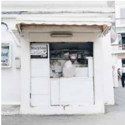
LE MARCHAND DE NOUGAT, AU COIN DE LA RUE SIAGHINE

€€ / 1, rue Kachla (place du Tabor), Kasbah elmoroccoclub.ma