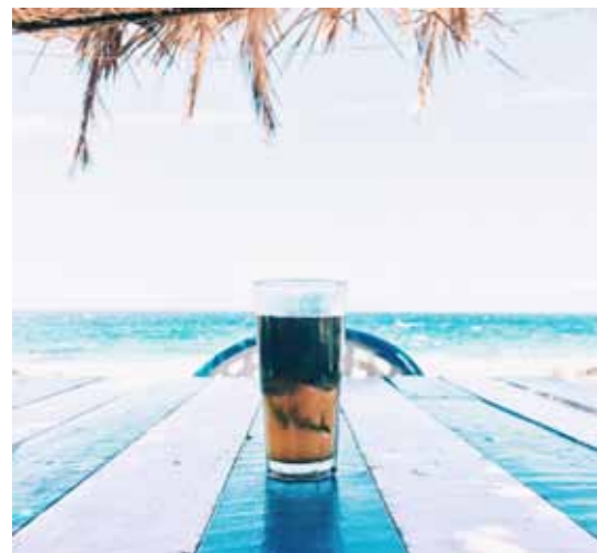
CAFÉ DE LA PLAGE