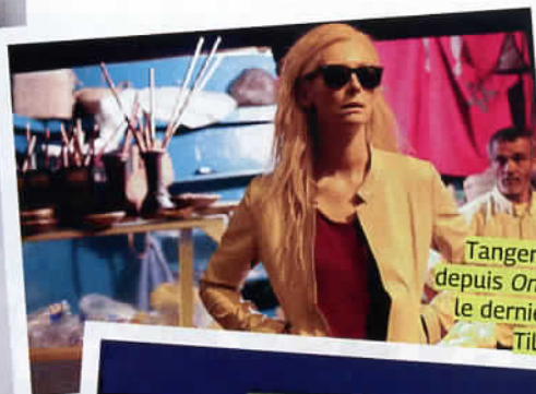
Tanger, destination cool depuis Only Lovers Left Alive , le dernier Jarmusch, avec Tilda Swinton.

On craque littéralement pour ce palais transformé en maison d'hôtes, idéalement situé en pleine kasbah, coïncé dans une ruelle minuscule où on se sent plus dans une chambre d'amis que dans une chambre d'hôtes. Mais surtout, impossible de résister au brunch gargantuesque servi sur la terrasse qui surplombe tout Tanger. Magique. www.darnour.com