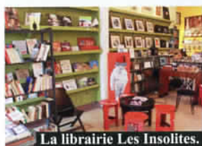
La librairie Les Insolites.

sélection courte mais pointue de romans, beaux livres et recueils de poésie.