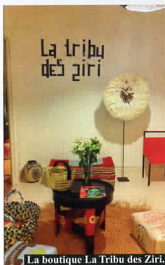
La boutique La Tribu des Ziri.

Encore confidentiel, ce petit restaurant-salon de thé possède l'une des plus jolies vues. Perchées sur les remparts de la vieille ville, face à l'Espagne, les quelques tables juponnées vous invitent certes à la contemplation, mais pas seulement : la