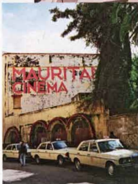
Les grands taxis jaunes de Tanger.

On fait quoi ? On se perd dans le labyrinthe de venelles de la Casbah. Tôt ou tard, on débouche sur une place dégagée, celle du musée de la Casbah, ancien palais du Sultan, à visiter. De là on redescend vers la bouillonnante Medina. Toujours animée, la place du Petit Socco a des airs espagnols avec ses balcons en fer forgé et ses enseignes de cafés écrites dans la langue de Cervantes. À Tanger, nombreux sont ceux qui parlent espagnol. Sur la place du Grand Socco, la cinémathèque Rif est le rendez-vous des artistes et des jeunes intellos tangerois ( cinemathequedetanger.com ). Pour délasser ses mollets – les rues de Tanger sont raides – on s'offre un hammam privé à la maison d'hôte La Tangerina ( latangerina.com ). Moins glamour, mais incontournable, la balade sur les docks de Tanger. Pause déj dans l'une des gargotes roots du port pour déguster avec les doigts des plats de poissons grillés, tout frais pêchés. Le lendemain matin, on ira