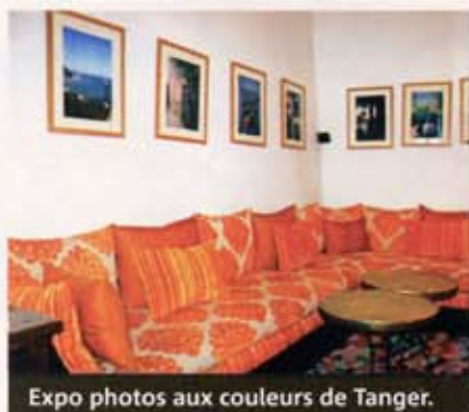
Expo photos aux couleurs de Tanger.