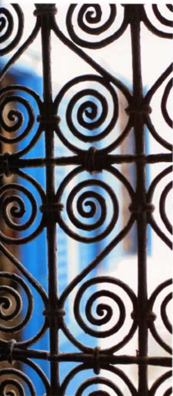
Le minaret de la mosquée Sidi Bou Abid domine la place du Grand Socco. Le jardin du musée de la casbah offre bien plus à admirer que ses grilles.