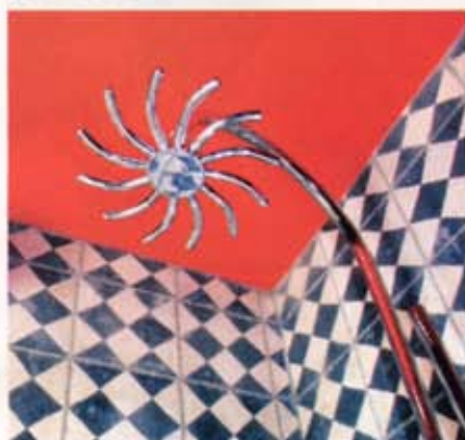
La suite Jassim et sa douche design.