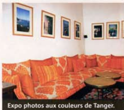
Expo photos aux couleurs de Tanger.